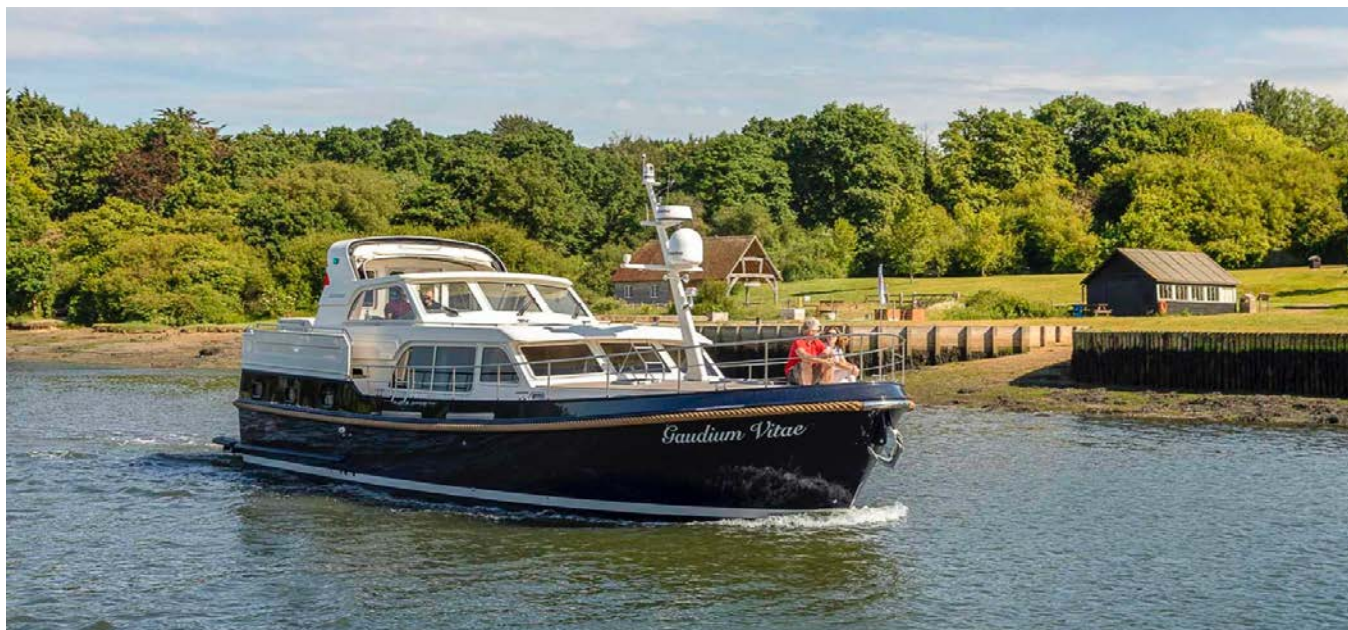
GS500ACVT – Eines von vielen Booten aus der Werft 52.