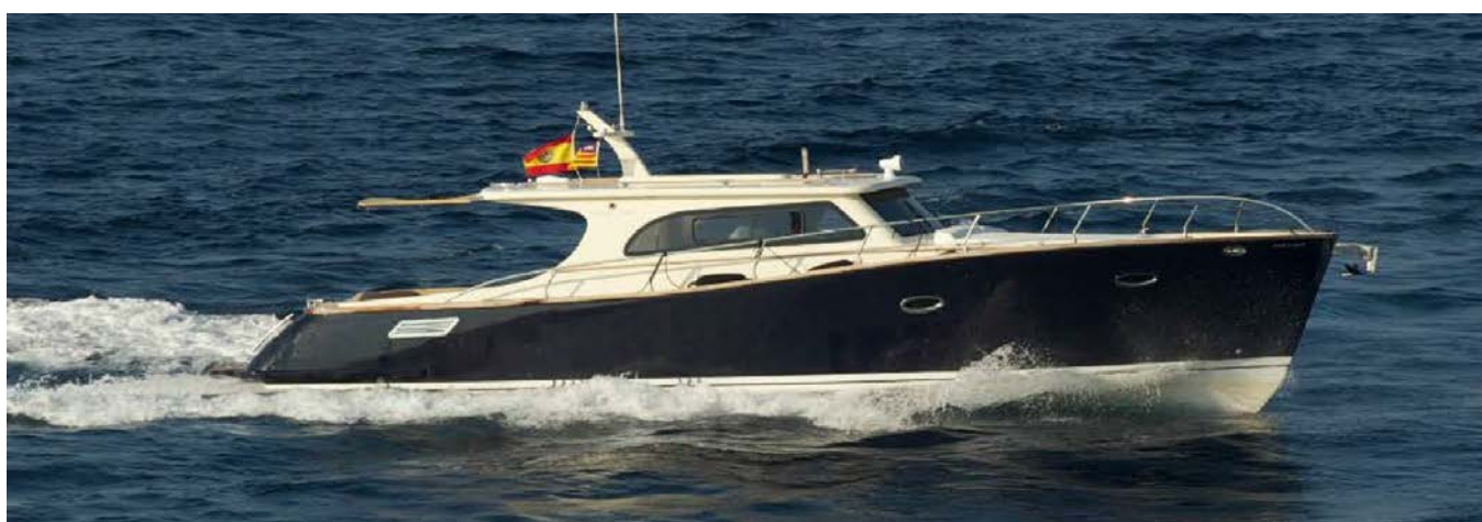
Lobster 39 – Perfekt geeignet für den Bodensee.

Text: Marius Geiger